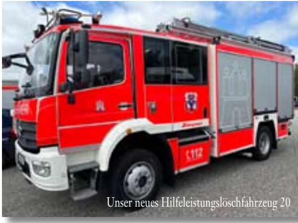
Unser neues Hilfeleistungslöschfahrzeug 20

Aber auch danach wird es noch die Möglichkeit geben, das Fahrzeug zu sehen, denn unsere Fahrzeughalle am Saseler Parkweg hat neue Tore bekommen. Ausgetauscht wurden die alten, manuell zu bedienenden grauen Tore ohne Möglichkeit der Durchsicht, gegen durchsichtige und vollelektronische Rolltore. So ist jetzt jederzeit ein Blick auf unsere beiden Fahrzeuge möglich.